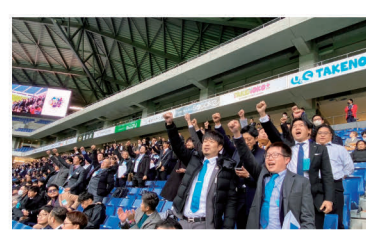
高山部員へのエール／11月27日

全国の青年部員と積極的に交流をすることで、地域の若き担い手としての資質を向上させる大会となりました。