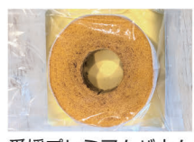
愛媛プレミアムパウムソフトホール