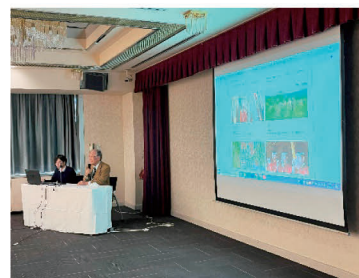
プレゼン発表の様子

当日は、事業者と商工会の支援担当職員が集い、各社ホームページの特徴やこだわりを10分程度で披露し、審査を経て受賞者を決定しました。いずれのホームページも内容の充実とともに、デザイン性にも優れ、心をひかれる仕上がりでした。表彰後の審査委員からのアドバイスをもとに、ホームページのさらなる改良に鋭意取組中です。