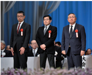
代表受賞する矢原越智商工会会長 (左)