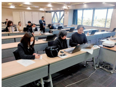
ブラッシュアップ支援の様子

県商工会連合会は、全国商工会連合会が推奨するホームページ作成サービス「グーペ」活用促進の一環として、12月12日、ホームページ作成コンテストを開催しました。