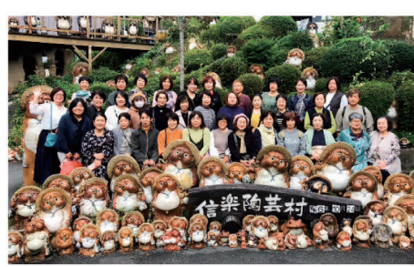
信楽陶芸村にて／10月24日

主張発表大会では、今後の女性部活動の参考となる事例を聴き大いに刺激を受けるとともに、部員同士の交流を深めることができた大変有意義な大会となりました。