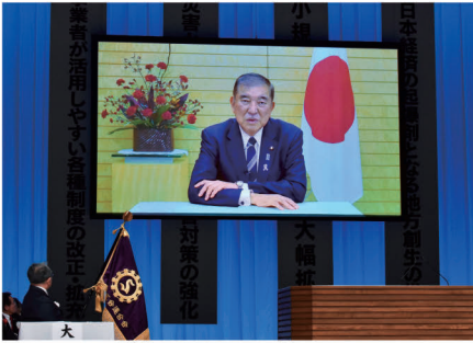
石破内閣総理大臣からのビデオメッセージ