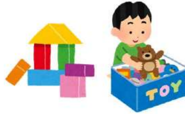
子供用特定製品 (イメージ)