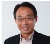
岡田 武史氏 FC今治高校学園長 元サッカー日本代表監督

地域経済における既存事業の可能性や新たな挑戦に対する心構え、組織経営のマネジメントについて語る。