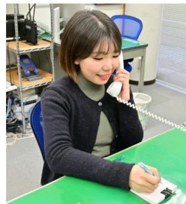
鬼北町商工会 経営支援員