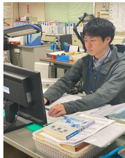
越智商工会 経営指導員