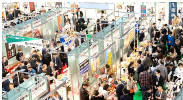
多くの来場者でごった返すこだわり商品コーナー

こだわり商品コーナーは、バイヤーの支持が高く、来場者の数・質共に高いコーナーであることから、前回は 出展案内開始から10分で募集枠が埋まり、キャンセル待ちが出るほどの人気 を誇る。