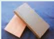
砥部陶板 (有伊予鋳業所)