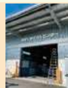
株式会社アイリック 空港リサイクルセンター