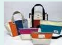
1010かばん (株四国中央テント)