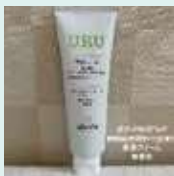
URUシリーズ (NM FIRM)