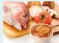
真鍋のトマトスープ・鍋のあら炊きスープ (企業組合こもねっと)