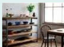
瀬戸内造船家具 (瀬戸内造船家具プロジェクト)