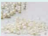
パールチップ (有土居真珠)