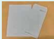
色綿紙 (愛媛県繊維染色工業組合)