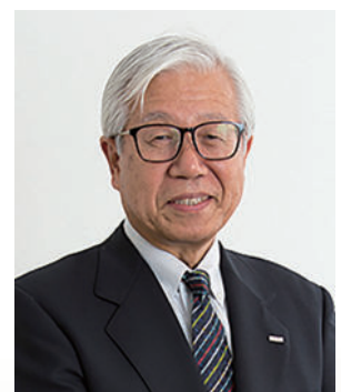
第5回日本サービス大賞委員会 委員長

原材料やエネルギー価格などの高騰に苦慮しながらも、賃金水準の向上に果敢に挑戦し、人的資本や技術開発投資・仕組み革新への配慮も怠らない、新型コロナ危機後の新しい日本企業の姿が次第に明らかになりつつあります。その変革を先導するものこそが、革新的な優れたサービスの全面展開であって欲しい。かたや、頻発する自然災害や、本格化する人口減少、医療・健康・教育・エネルギー・地球環境問題の深刻化等、社会経済システム全体に課題が山積するなかで、これらに解決の糸口を創り出すのもサービスイノベーション。私たち生活者の暮らしや、経済を一変させる勢いを持つ「革新的な優れたサービス」の登場を熱望しています。