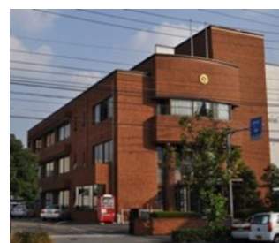
愛媛県商工会連合会