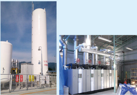
設備写真