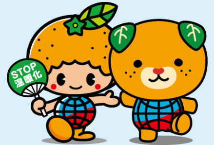
地球温暖化防止キャラクター「ストッピー」 & 愛媛県イメージアップキャラクター「みきゃん」