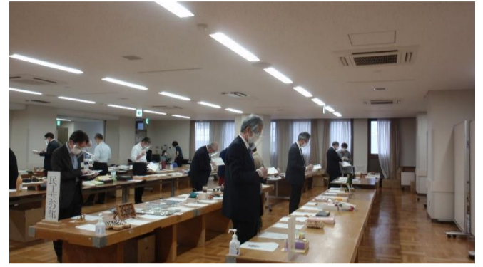
< 審査風景 >