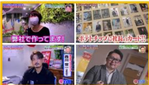
テレビ朝日『ナニコレ珍百景』