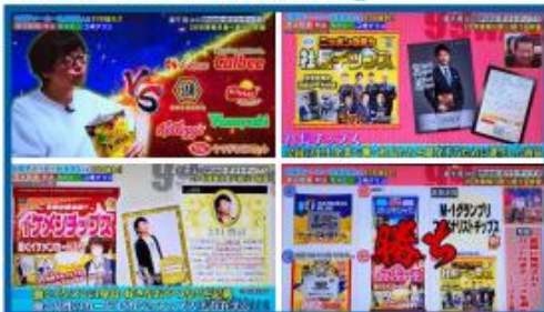
フジテレビ『99人の壁』