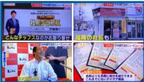
テレビ西日本『ももち浜S特報ライブ』