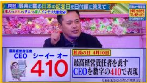
フジテレビ『今夜はナゾトレ』