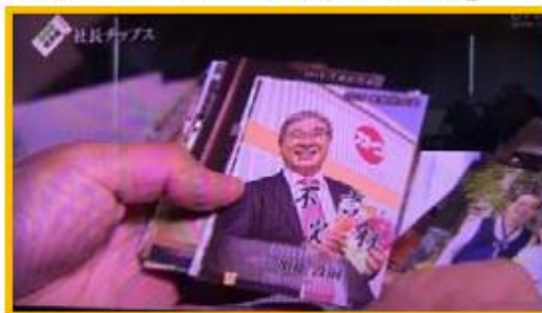
日本テレビ『ぶらり途中下車の旅』