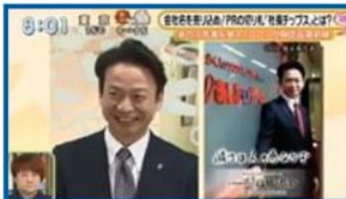
日本テレビ『スッキリ』