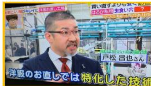
日本テレビ『ヒルナンデス!』