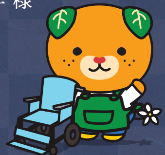
愛媛県イメージアップキャラクター みきゃん