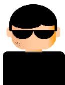
攻撃者 (A社のなりすまし)