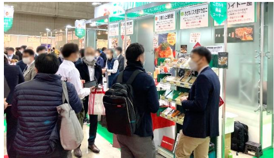
前回のこだわり商品コーナーの様子

こだわり商品コーナーは、バイヤーの支持が高く、来場者の数・質共に高いコーナーであることから、前回は出展案内開始から10分で募集枠が埋まり、キャンセル待ちが出るほどの人気を誇る。