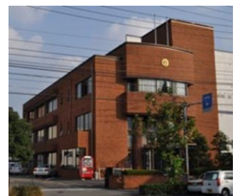
愛媛県商工会連合会