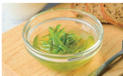
【審査員特別賞】 愛媛県産れもんマーマレード (株)阿彩都

本事業に出展すると、約40社のバイヤーに商品の魅力をアピールできるほか、褒賞による付加価値向上や個別商談が期待できます。次回機会での皆様のご応募をお待ちしております。