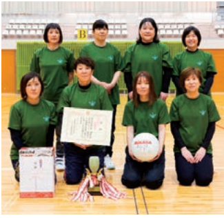
優勝／松野町商工会女性部