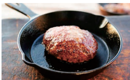
【全国商工会連合会賞】 はなが牛ハンバーグ (株)ゆうほく