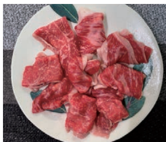
一人暮らしのお年寄り向きなど地域に根差したお肉屋さんです