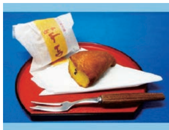
上浦町銘菓「芋吉」 鳴門金時の風味と ホクホクとした食感が特長です