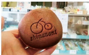
「サイクリングどら焼き」 生地には「大三島産レモン」を使用し、餡には、オレンジ餡と定番の小豆餡を上下にサンドしています

HPは、しまなみ商工会の支援を受けながら作成し、商品の特長をPRしています。 楽天市場（愛媛県観光物産協会公式オンラインショップ）からお求めください。