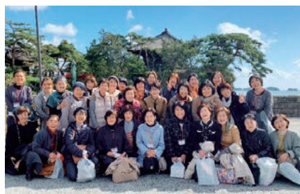
松島海岸にて／10月26日

視察研修では、蔵王山の釜房湖、瑞鳳殿、国宝の瑞巖寺、日本三景の松島湾等を視察し、松島海岸では宮城県女性部員による歓迎のおもてなしを受けました。部員同士の交流を深め、今後の女性部活動の参考となる大会となりました。