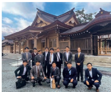
阿蘇神社にて／11月15日

演いただきました。全国の青年部員と交流する機会を得られ、地域リーダーとしての資質を大きく向上させる大会となりました。