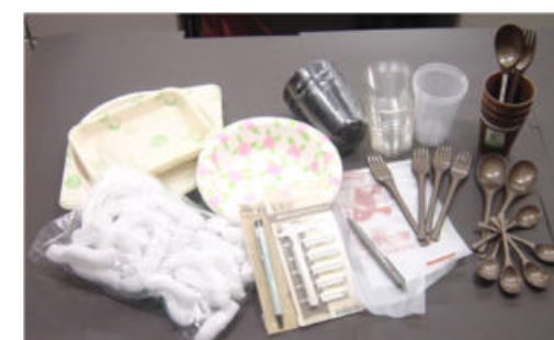
サステイナブル容器等(紙・プラ)