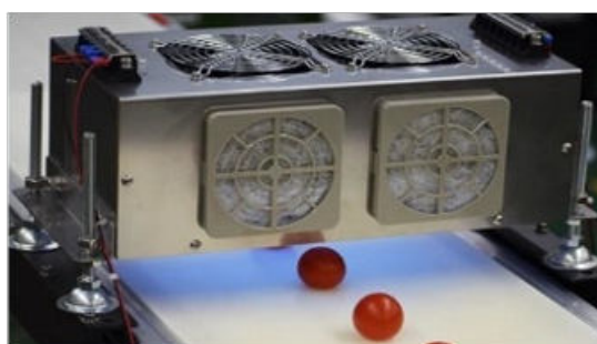
消費・賞味期限延長(UV活用)