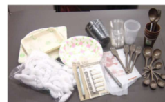
サステナブル容器等(紙・プラ)