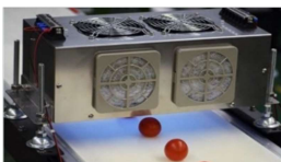
消費・賞味期限延長(UV活用)