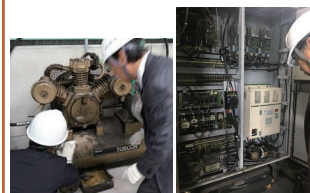
▲ 使用設備や分電盤等をチェック