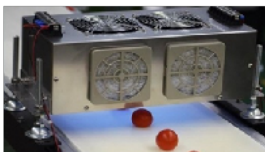
消費・賞味期限延長 (UV活用)