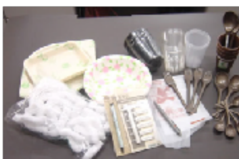
サステイナブル容器等 (紙・プラ)