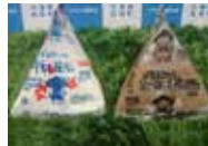
日本テレビZIPにて商品紹介