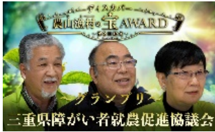
取組紹介のPR動画(グランプリ地区)