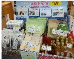
アンテナショップでのイベントコーナー

「ディスカバー農山漁村の宝」に選定された地区に対しては、特設 Web サイト等で活動を紹介するほか、PR 動画の制作、アンテナショップでのイベント出展支援、メディア媒体での記事掲載など、全国へ幅広く発信しています。