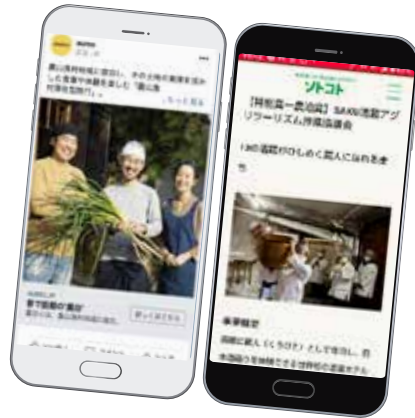
メディア媒体(アウモ、ソトコト)での記事掲載