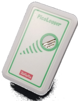
CO 2 センサー（6ヶ月貸出） <USB電源又は単三乾電池2本使用>