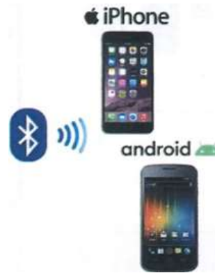
お手持ちのスマホやタブレットPC にアプリをインストールして利用