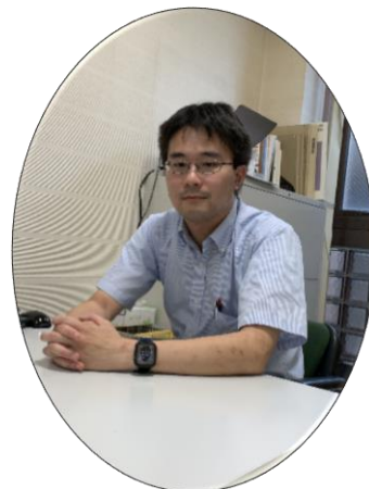
松前町商工会 経営支援員