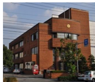
愛媛県商工会連合会