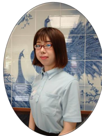
砥部町商工会 経営指導員