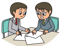
売上高減少の防止・軽減 営業継続費用