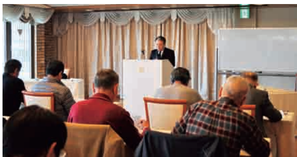
講師の話に真剣に聞き入る参加者

また、最近では商工会職員による不祥事が全国で多発していることから、経理処理に係る管理運営体制を再確認し、不祥事再発防止の徹底を図るよう周知がありました。