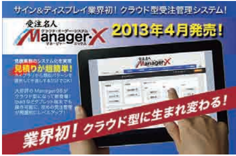
タブレットでも利用できるクラウド版ソフト

丁度十四年前、情報化社会 の進化の波を受け、業務の大 幅な改善を目指して、見積業 務を中心とした企画から受注 生産・納品・請求までの流れ を一元管理するシステムソフ トを自社開発し、社員全員が 使いつつも、業界に貢献すべ く全国販売しております。