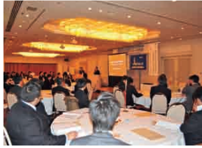
熱心に聞き入る青年部員