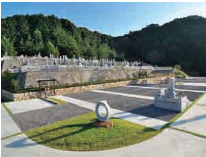
現在は第三期分譲地まであります

お墓は「愛」と「感謝」の 泉です。お墓参りをするこ とによって、より多くの人々に 幸せになって頂く事を望みま す。皆様、是非ご先祖様に会 いに行ってください。