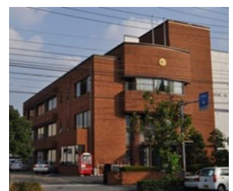
愛媛県商工会連合会